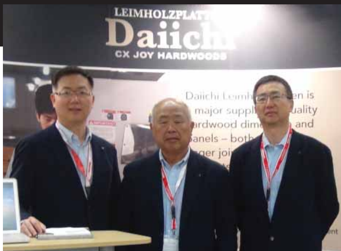
林氏父子创立青岛春喜硬木

青岛春喜硬木是实木家具业界知名的专业拼板厂。成立超过20年，只有100人，每年加工数万立方的美国锯材，立志做到拼板界的质量第一……这几句话为我们简单勾绘出客观轮廓。这家传承了台湾木工精神、被称为“世界级实木拼板企业”的拼板厂，将从专业备料的角度来谈美国木材的优势。