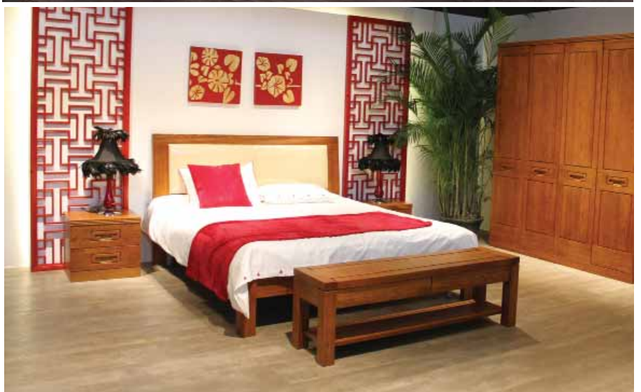
黄金桤木/黑胡桃/红橡家具by中国品牌北京百强