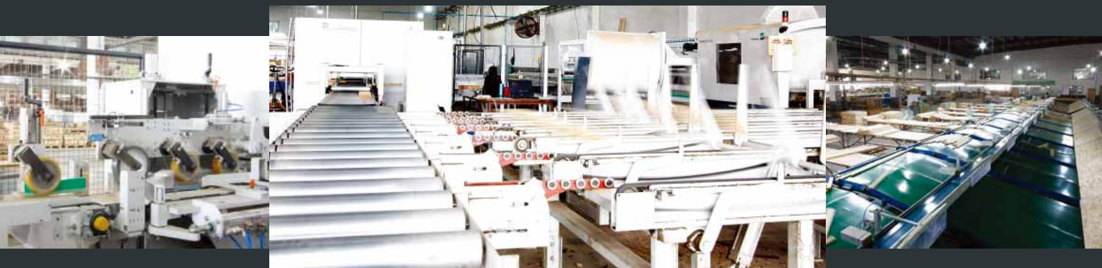
青岛春喜硬木以世界领先的设备大量供应黄金柁木拼板