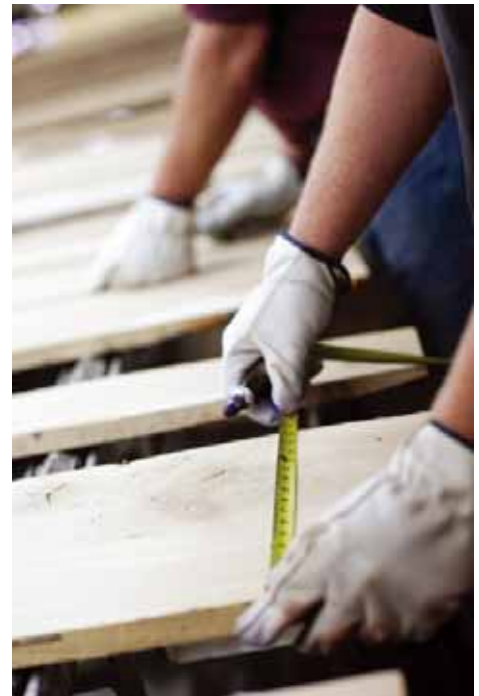
美国西北硬木细化了黄金桤木的分等