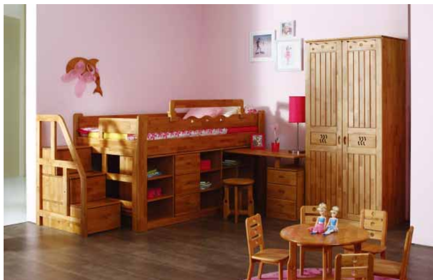
黄金柁木做的儿童家具·百强哈利木屋

对家具制造者而言，黄金柁木具备了良好的可塑性，除了上述种种的加工优势外，所制成的家具能够轻易地融入各种空间与也是重要的特点，无论是深色或浅色地板、胡桃木门或是橡木窗，以自然色呈现的黄金柁木家具都能够很轻易地融入其中。近年来寻找新树种似乎成为国内实木家具业的流行活动，但若仔细考量开发产品需面对的各种风险：价格的稳定、供应量的稳定度、等级的稳定度、加工的难度、环保、合法性、流行年限与研发效益评估等等，黄金柁木这个在欧美与日本市场持续“流行”超过几十年的树种，是不是显得优点齐备，值得好好地重新认识呢？